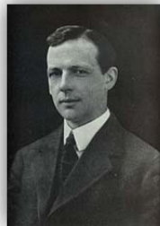
چارلز ادوارد مریام (۱۸۷۴-۱۹۵۳)

چارلز مریام ۸ و هارولد لاسول، دو تن از پدران روان‌شناسی سیاسی، بیش همه ایده‌های فروید را در مطالعه سیاست به کار گرفتند. مریام به عنوان استاد لاسول، نخستین تأثیر فکری را بر او داشت. اما چون لاسول آن ایده‌ها را به نگارش در آورد، اغلب لاسول را اولین روان‌شناس سیاسی آمریکایی و گاهی اوقات اولین روان‌شناس سیاسی می‌دانند. کتاب‌های «آسیب‌شناسی روانی و سیاست» ۹ و «قدرت و شخصیت» ۱۰ او که به ترتیب در سال‌های ۱۹۳۰ و ۱۹۴۸ منتشر شدند، آثاری شاخص در این زمینه بودند.