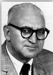
هارولد لاسول (۱۹۰۲-۱۹۷۸)

مریام استاد علوم سیاسی دانشگاه شیکاگو بود. از آثار مهم وی می‌توان ابعاد جدید سیاست، دموکراسی نو و استبداد نو (۱۹۳۹)، و برنامه‌ی دموکراسی (۱۹۴۱) را نام برد.